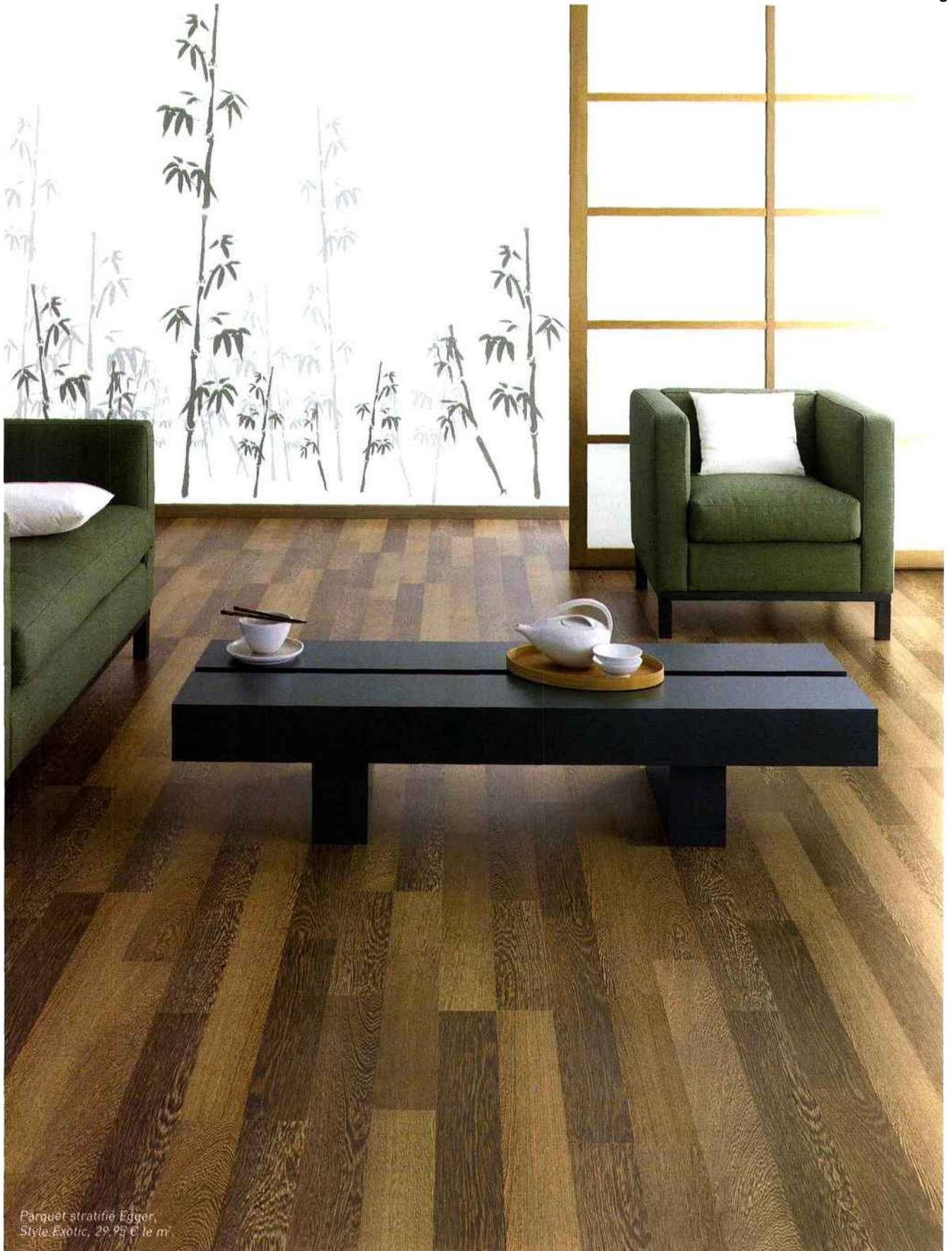
Parquet stratifié Egger, Style Exotic, 29,95 € le m 2