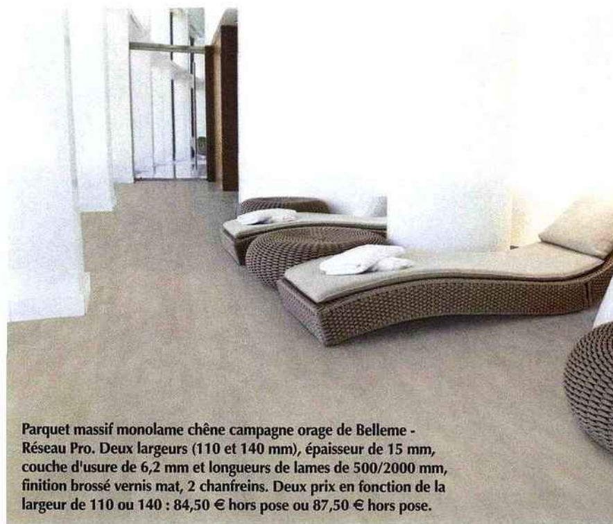
Parquet massif monolame chêne campagne orage de Belleme - Réseau Pro. Deux largeurs (110 et 140 mm), épaisseur de 15 mm, couche d'usure de 6,2 mm et longueurs de lames de 500/2000 mm, finition brossé vernis mat, 2 chanfreins. Deux prix en fonction de la largeur de 110 ou 140 : 84,50 € hors pose ou 87,50 € hors pose.