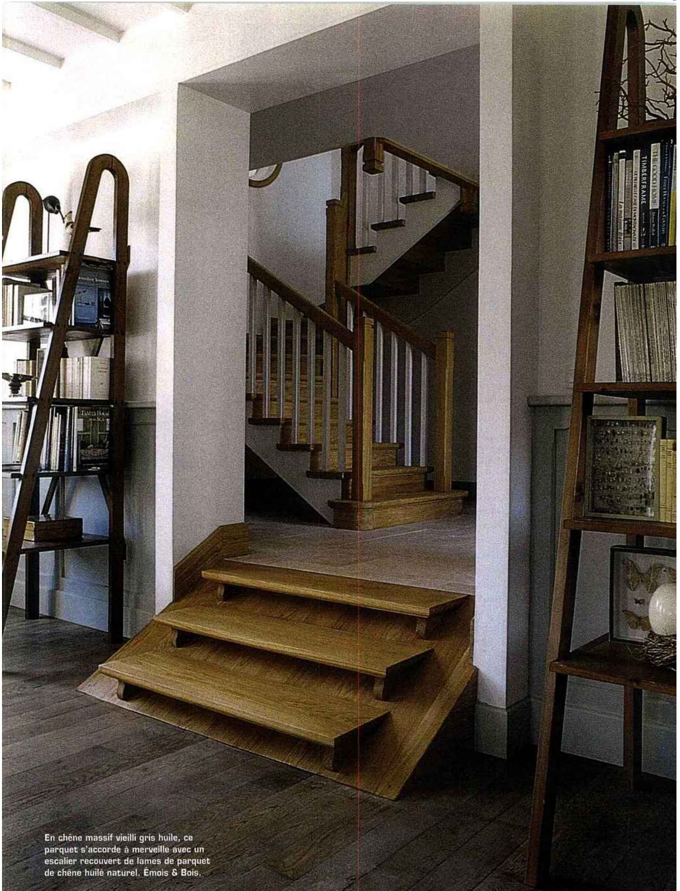
En chêne massif vieilli gris huile, ce parquet s'accorde à merveille avec un escalier recouvert de lames de parquet de chêne huilé naturel. Émois & Bois.