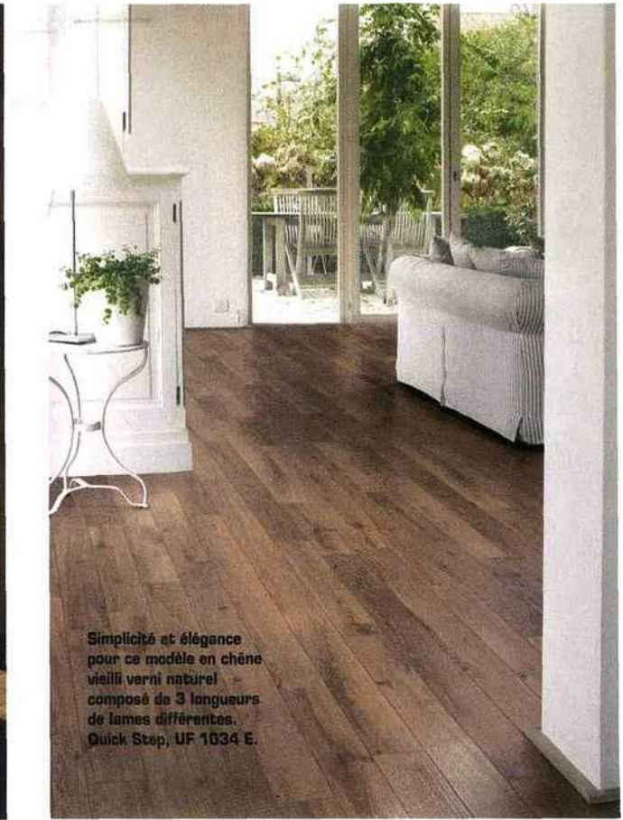
Simplicité et élégance pour ce modèle en chêne vieilli verni naturel composé de 3 longueurs de lames différentes. Quick Step, UF 1034 E.