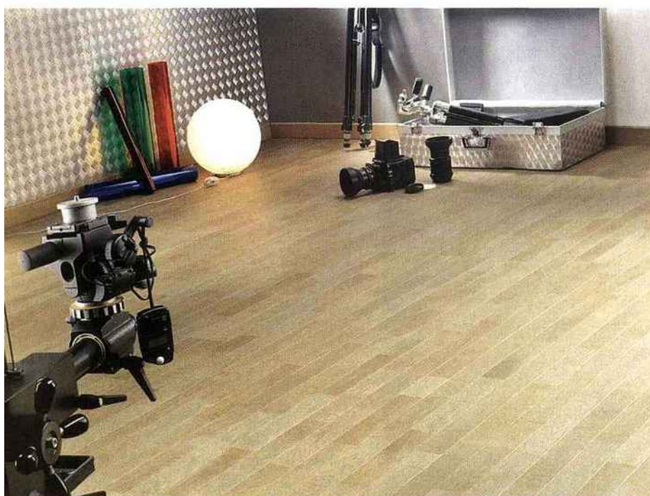
Phyléa est une collection de produits imitant le massif à s'y méprendre. Ce complexe présente deux frises par lame, chacune bordée d'un chanfrein qui masque le passage d'une lame à l'autre. Sur la photo, le chêne vieux Millésime exprime toutes les nuances d'une surface huilée, pourtant, son entretien est celui d'une surface vitrifiée. C'est l'avantage de la finition Vmax®, invisible et exempte de solvant, formaldéhyde et autres isocyanate. CFP.