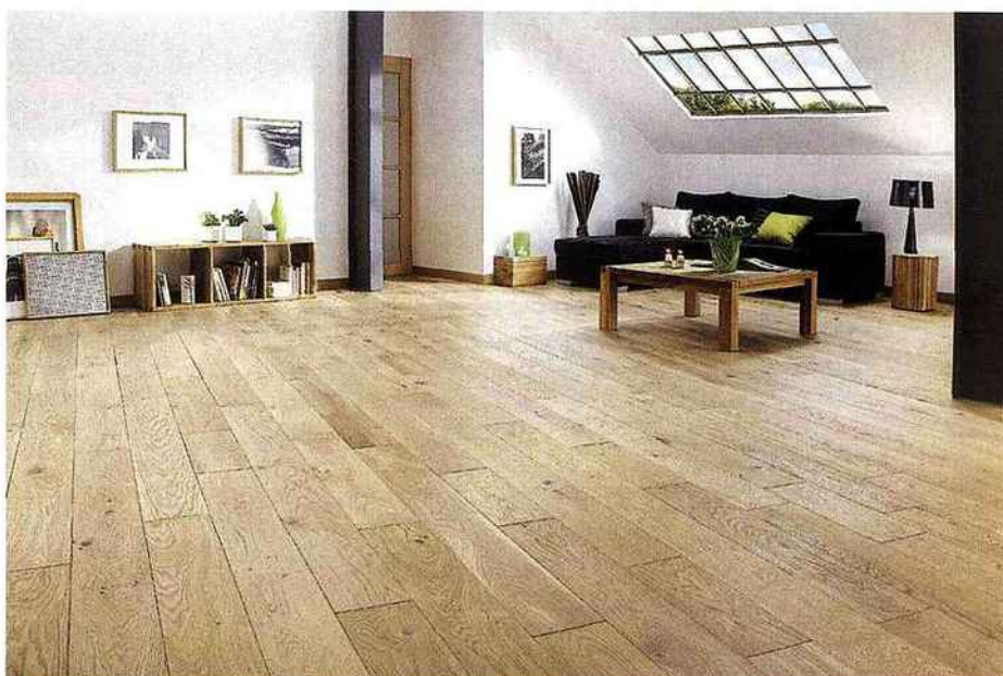
Les teintes Zénitude nuancent d'un léger beige écru les supports. Une matière première nervurée, veinée, structure le parquet contrecollé Chêne Linen qui, dans la collection Diva, reçoit également 4 chanfreins encadrant ses lames. À partir de 89 €/m². Panaget.

bois d'une moindre densité comme les résineux, d'économiser sur la structure tout en conférant à l'étage une isolation 12 fois supérieure à celle du béton !