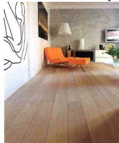
La collection Couleur du temps met en scène du chêne européen sur 15 mm d'épaisseur pour le parquet massif, ou avec une couche d'usure de 3,6 mm pour le contrecollé. Bois nobles et âme composite sont certifiés PEFC. Les colles et les produits de finition respectent la réglementation sur les COV (composés organiques volatils). Massif : 3 largeurs à partir de 85 €/m². Contrecollé, 15 mm d'épaisseur, chanfrein sur 2 ou 4 côtés, à partir de 87,50 €/m². ÉMOIS & bois.