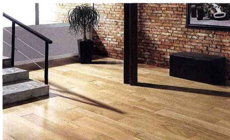
Une surface vernie à l'apparence de bois flotté, c'est la dernière finition à la mode. Cet appel du naturel fait écho à la gamme Diva, de larges lames (18,4 cm) au parement de chêne de 3,4 mm d'épaisseur. Ce parquet contrecollé est proposé en lames de 4 m à 2 m de longueur. À partir de 97 €/m². Panaget.

Il faut également garder en tête que le bois est une matière vivante, et à ce titre, il répercute les changements d'hygrométrie de votre intérieur. Aussi, avant de pousser le chauffage, installez un humidificateur d'air, un récipient d'eau, afin de ne pas dessécher l'atmosphère de vos pièces. C'est mieux pour votre parquet, pour vos meubles, et même, pour vous. C.J.