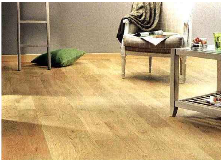
Millésime est un parement de chêne vieilli, ici présenté en 140 mm de largeur (longueur : 2 000 mm). L'aspect de cette surface est légèrement grisé, les lames étant choisies pour leur expressivité (nœuds apparents, veinage contrasté). Concernant les produits CFP, selon leur format (longueur, largeur), l'essence et la finition choisies, les prix vont de 40 à 110 €/m². CFP.

Grande tendance du moment, le parquet huilé. Dans ce cas, il est recommandé d'huiler à nouveau le parquet fini en usine avant de marcher dessus. Une fois la surface sèche, on applique alors le savon d'entretien. Le soin courant se limite comme précédemment au balais et à l'aspirateur. Concernant les marques sur ce support, il faut procéder comme avec du carrelage : une serpillière trempée dans de l'eau additionnée d'1/40 e de savon spécial parquets huilés.