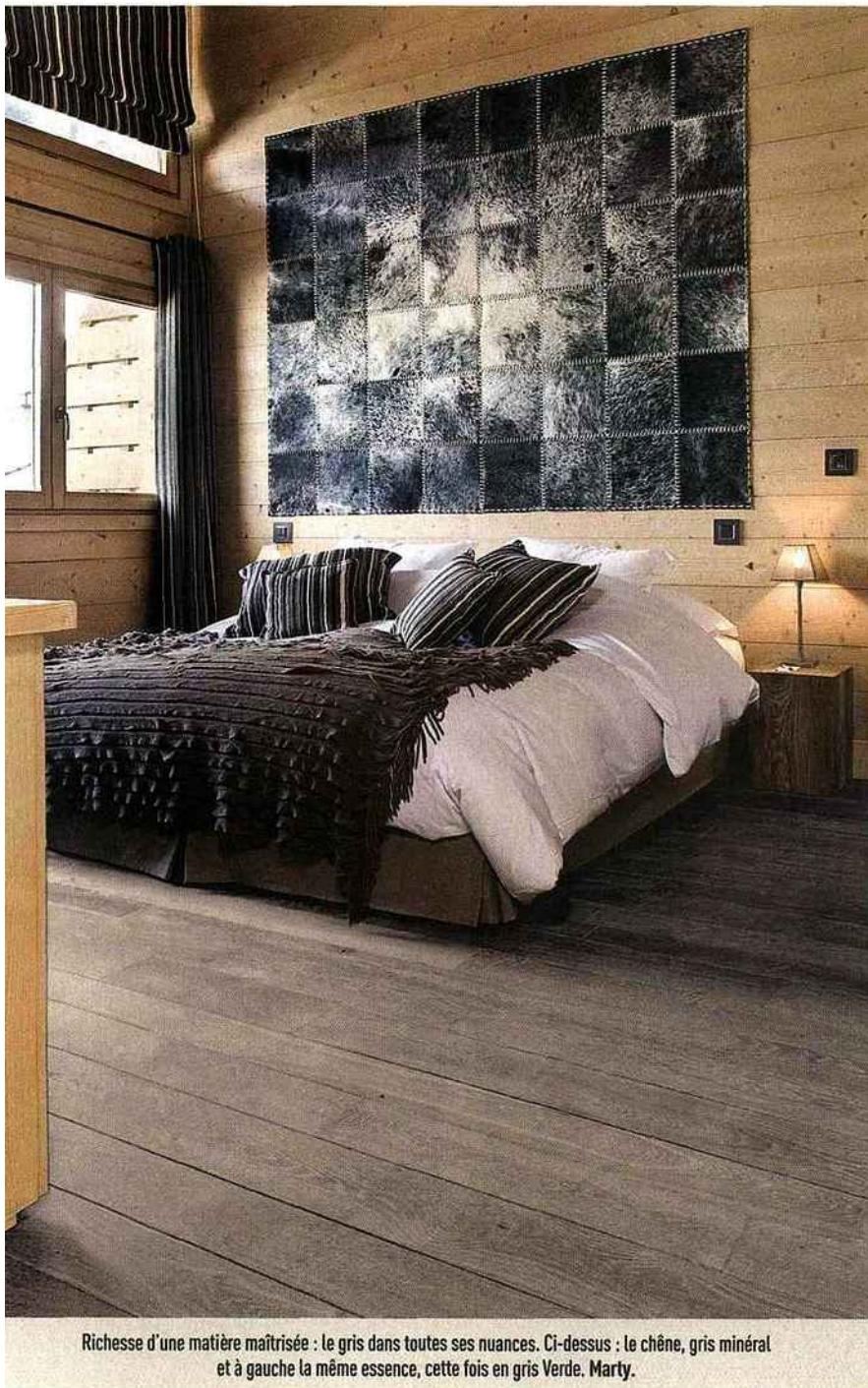
Richesse d'une matière maîtrisée : le gris dans toutes ses nuances. Ci-dessus : le chêne, gris minéral et à gauche la même essence, cette fois en gris Verde. Marty.

Chaleureux, les parquets garantissent le confort et l' hygiène de l'intérieur. Attention cependant à bien choisir le produit , car tout ce qui semble en bois n'est pas forcément un parquet... Reste à adapter l' entretien à la finition .