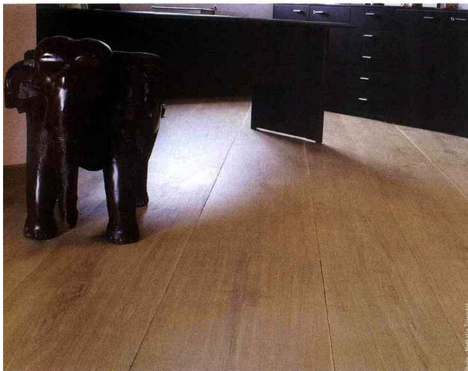
Les ateliers bourguignons réalisent des surfaces contrecollées mais avec 100 % de chêne. Les lames sont chanfreinées sur leur longueur et aux extrémités. Un produit atypique, dont les lames sont longues de 3 000 à 4 800 mm et larges de 250 à 450 mm. Finition simple et naturelle, poncé brossé et huilé. Parqueterie de Bourgogne.