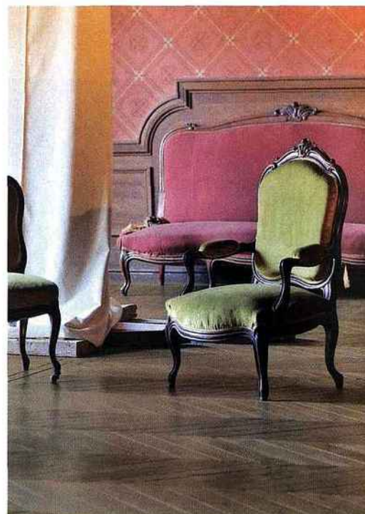
Variance est une gamme de parquets contrecollés dont l'originalité est de présenter des lames biseautées (590 x 90 mm). Ce qui permet d'adopter un motif "point de Hongrie" ou "fougères" sans devoir retailler l'extrémité de chaque lame. Pose classique mais look contemporain pour des surfaces en cinq nuances, du très clair "cérusé brossé" au noir intense du "teinté wengé brossé". Ici Variance, en chêne, teinte gris lauze, posé en point de Hongrie. Marty.