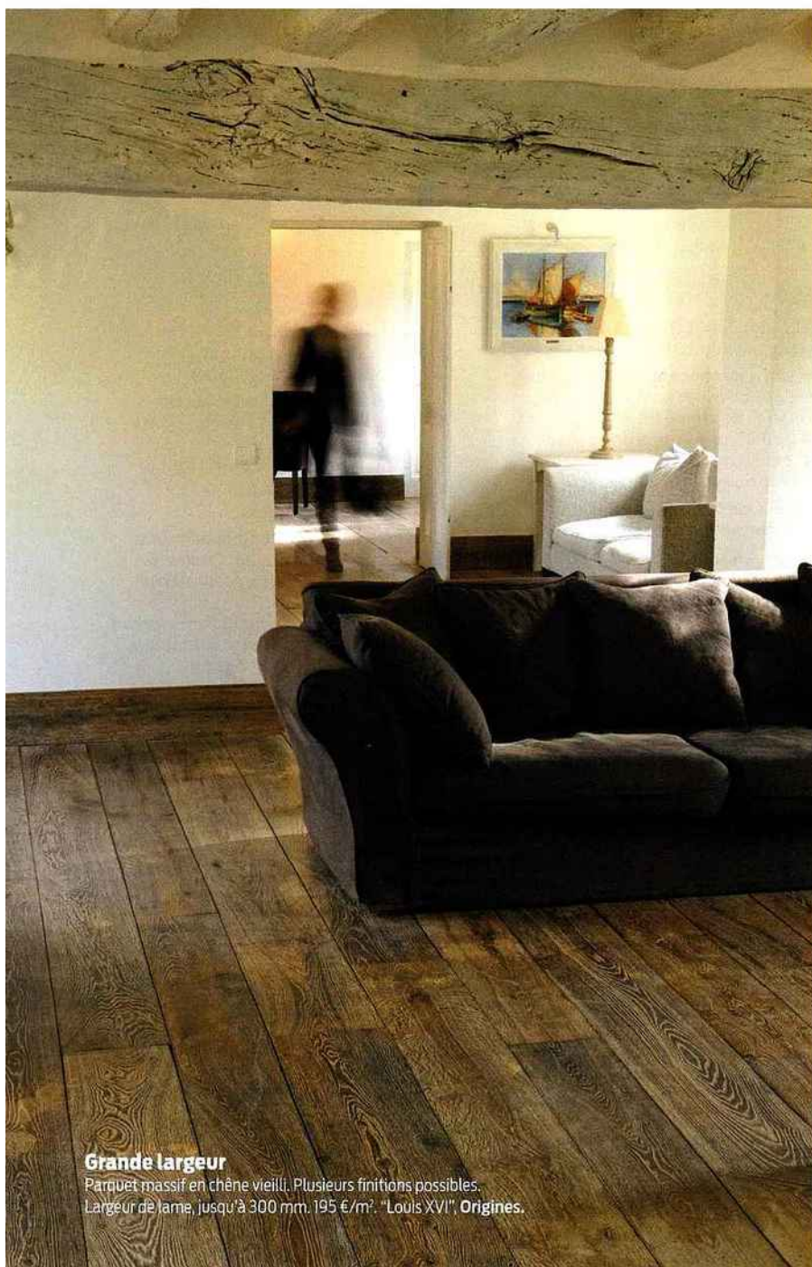
Grande largeur Parquet massif en chêne vieilli. Plusieurs finitions possibles. Largeur de lame, jusqu'à 300 mm. 195 €/m 2 . "Louis XVI". Origines.

Avec un large choix d'essences de bois, de largeurs et longueurs de lames, de possibilités de décors et de techniques de pose, le parquet a sa place dans toutes les pièces de la maison.