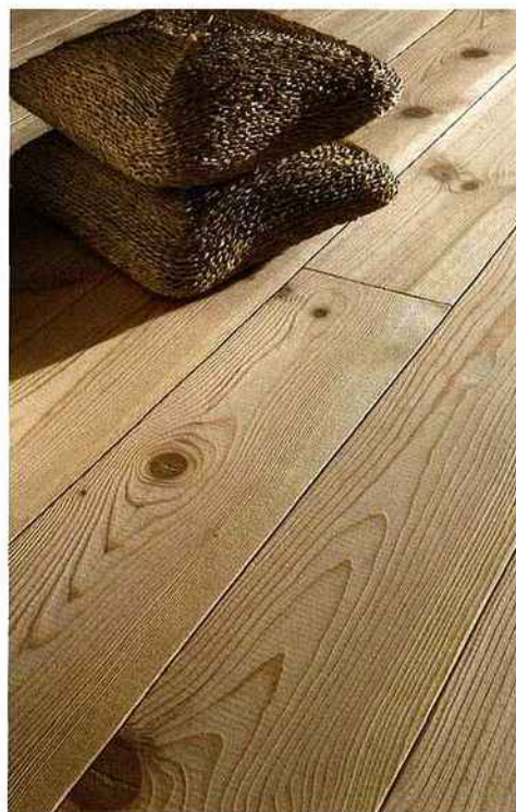
Brossé Pin des Landes massif, finition brossée. 40 €/m 2 . Finnforest.

Selon l'Union française des fabricants et entrepreneurs de parquet (UFFEP), le terme désigne "tout revêtement de sol en bois ou à base de bois dont la couche d'usure (la partie visible de la lame) a au moins 2,5 mm d'épaisseur". Cette définition vise donc exclusivement les parquets massifs et contrecollés. Avant de faire votre choix, découvrez les caractéristiques de chacun, car il faut tenir compte de plusieurs paramètres: l'usage fait de la pièce à laquelle il est destiné, la décoration générale et le budget. Les prix varient en effet en fonction de