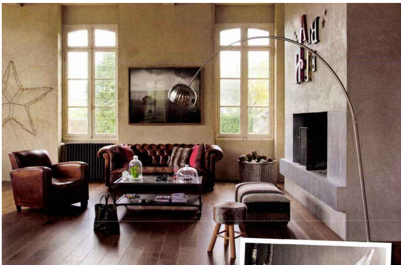
La teinte de ce parquet en chêne fumé, en accord avec une manière de vivre au naturel, apporte une note chaleureuse et légèrement précieuse aux sols. Berry Alloc.