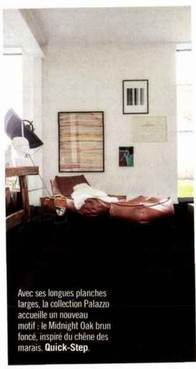
Avec ses longues planches larges, la collection Palazzo accueille un nouveau motif : le Midnight Oak brun foncé, inspiré du chêne des marais. Quick-Step.